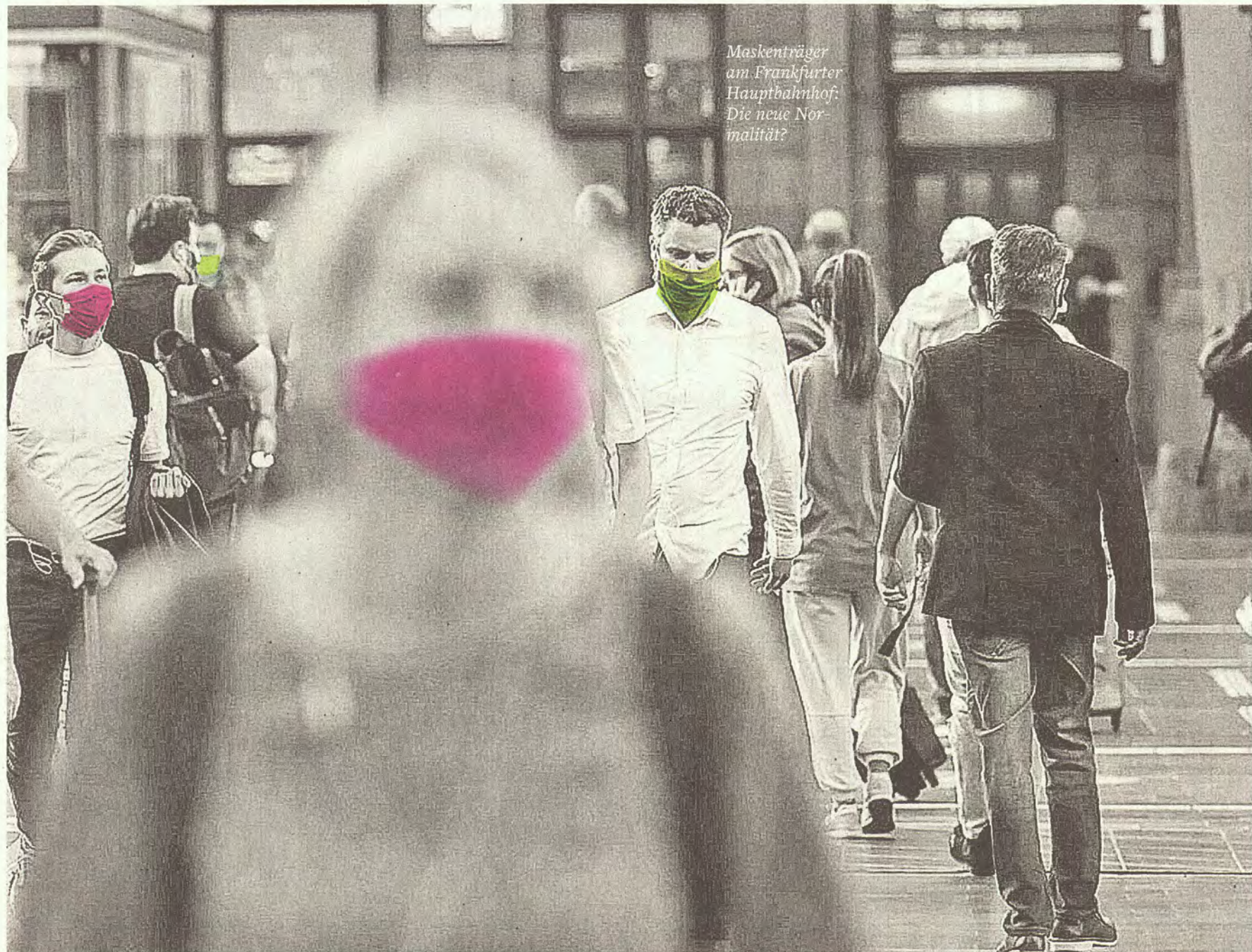
Maskenträger am Frankfurter Hauptbahnhof. Die neue Normalität?

Eine Produktion der Axel Springer Brand Studios im Auftrag von Rolex.